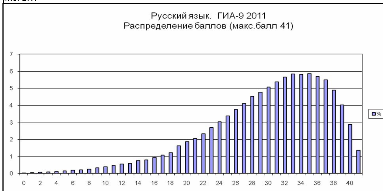
Рис. 2.1. Распределение участников экзамена по первичным баллам

Распределение участников экзамена по первичным баллам представлено на рис. 2.1.