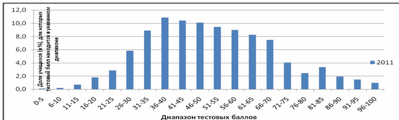
Рис. 8.1. Распределение участников по набранным ими тестовым баллам

На рис. 8.1 изображено распределение участников по набранным тестовым баллам.