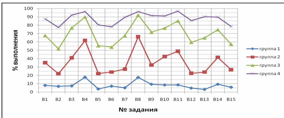
Рис. 8.3. Результаты выполнения заданий части 2 выпускниками с различным уровнем подготовки